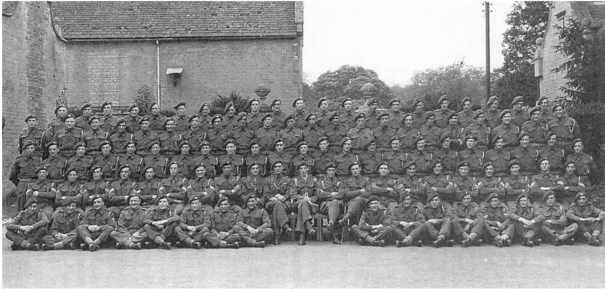
Foto van de A-compagnie van het 2 de Bataljon Parachutisten, genomen in Easton Hall (Lincolnshire) in juni 1944.

Tweede rij van boven, elfde van links: Smith.