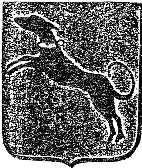
Het huidige Wapen der gemeente Ruurlo.