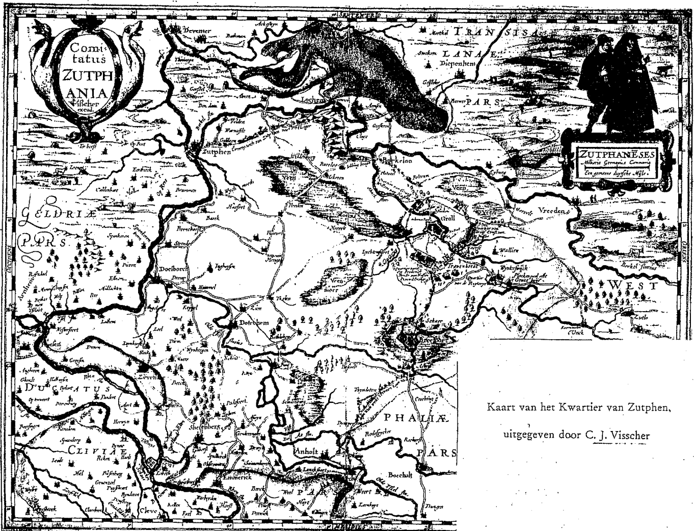
Kaart van het Kwartier van Zutphen, uitgegeven door C. J. Visscher