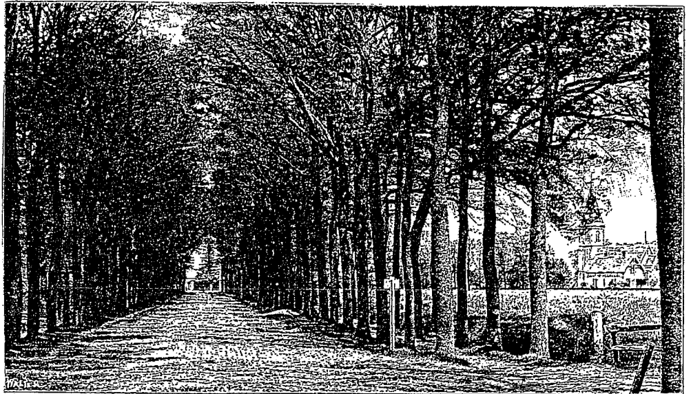
De groote laan te Ruurloo.

waarheen niet ver van het logement een breede zandweg leidt. Tusschen het logement en de R.C.kerk, aan een met zware boomen beplanten zijweg, vond men eertijds het logement "Het witte paard", een eenvoudig maar, onder hetzelfde bestuur als het tegenwoordige familiehotel, alle billijke eischen die aan het Ruurloo dier dagen gesteld mochten worden, bevredigend - en daarnaast de smidse, de vermaarde smidse