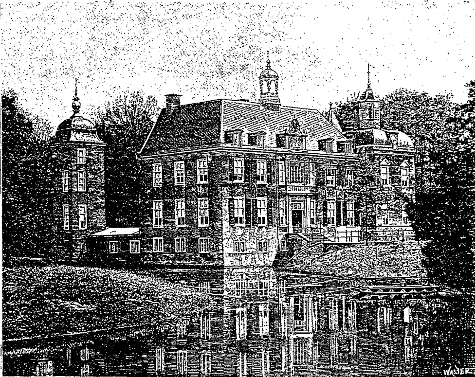
Het Huis te Ruurloo.

Gaat men, van het station komende, niet rechtsom naar het hotel, maar links, dan komt men op het gebied waar sedert eeuwen de Heeren van Roderlo zetelden. Het heerenhuis vertoont zich op eenigen afstand van den weg, recht tegenover een uitnemend schoone, breede laan, in vroeger dagen de oprijlaan van het huis, waardoor thans de groote rijksweg leidt. Uit deze laan kan men langs een zandweg door de korenvelden, of iets verder door ten deele deele nieuw aangelegde bosschen, het wilde bosch en daardoor weer, na een aangename wandeling,