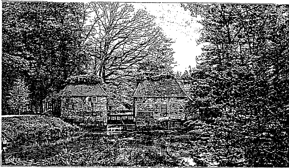
De Watermolen te Ruurlo.

Aan het slotpark grenst een der eigenaardige sieraden van het Geldersche landschap, de oude watermolen, zoo vriendelijk uitkomend onder het prachtige eikenhout en zijn witte muren en roode daken spiegelend in het heldere water aan zijn voet. Bij een langer verblijf biedt Ruurlo den gasten van het hotel overvloed van groote en kleine wandelingen en uitstapjes in den omtrek aan, maar ook de bezoeker, die