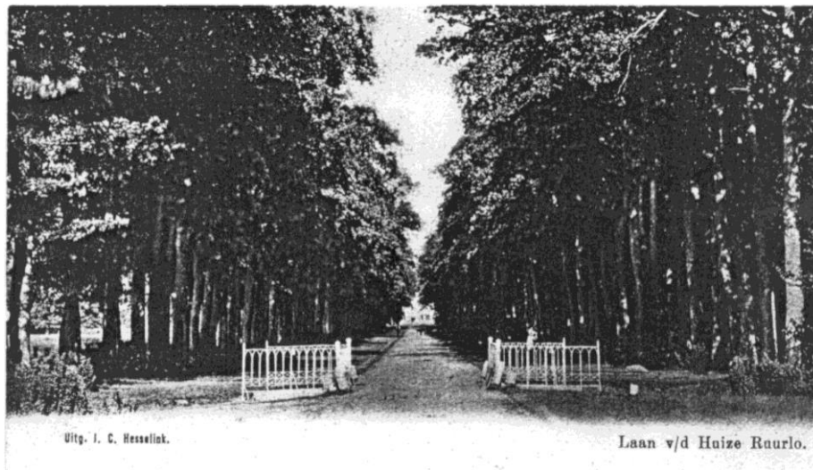
Uitg. J. C. Hesselink.

Al spoedig ziet U rechts de Kleine Forme, een Huize Ruurlo boerderij met de Gelderse luiken; daar achter ligt de Formerhoek, een zéér fraai terrein met afwisselend bos, weide en bouwland. Links komt dan de Engelse tuin, 't Mastbos en daarna de Kleine Meene, en daarna de Grote Meene, een machtig bos met vele woudreuzen. Maar vóór die tijd rechts in de bocht van de Vordenseweg, aan het begin van de voormalige statige allee richting Huize Ruurlo, is de boerderij Slagman. Daar was toendertijd de slagboom voor de toegang tot voornoemde allee. Als wij de Vordenseweg vervolgen, komen wij weer over een spoorbaan, waarover Bello de passagiers van Neede naar Ruurlo en vandaar naar Doetinchem brengt. Deze spoorweg is al 15 jaar in gebruik en rechts zien wij 't spoorbaanwachtershuis, dat met de opheffing van dit spoor in 1937 jachtopzienshuis wordt. Vervolgens komen wij over een witte brug, waarvan hieronder een briefkaart; hoe duidelijk ziet men hier dat er nog geen autoverkeer is, vandaar al die spoorwegen.