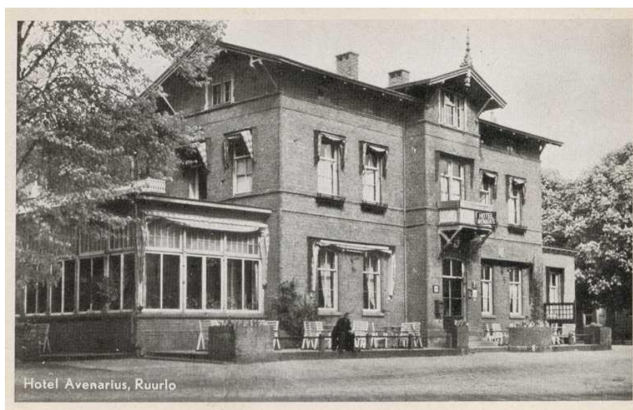
Foto van Avenarius uit 1948

Het geslacht Avenarius in casu de familie Meilink heeft een dusdanige invloed op het reilen en zeilen van het logement gehad dat het Wapen van Ruurlo al in de eerste jaren na 1900 de naam Avenarius kreeg.