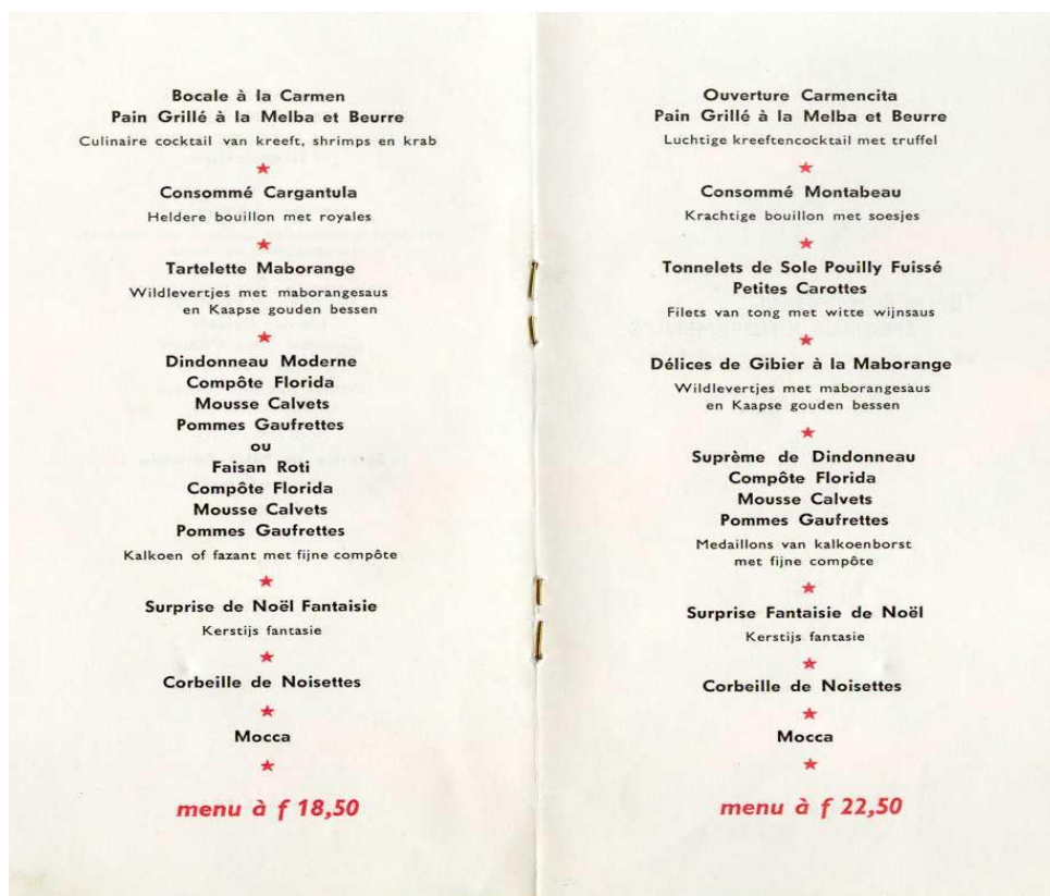
Deel uit het kerstmenu uit 1963

Over Avenarius en zijn dependances ( o.a voormalig pension De Graaf, villa Drosera en villa Gertrud) is natuurlijk nog veel meer te vertellen. Vele Ruurlo'ers hebben er gewerkt en misschien trekt er nog eens iemand aan de bel met een aardig verhaal. Wij houden ons aanbevolen!