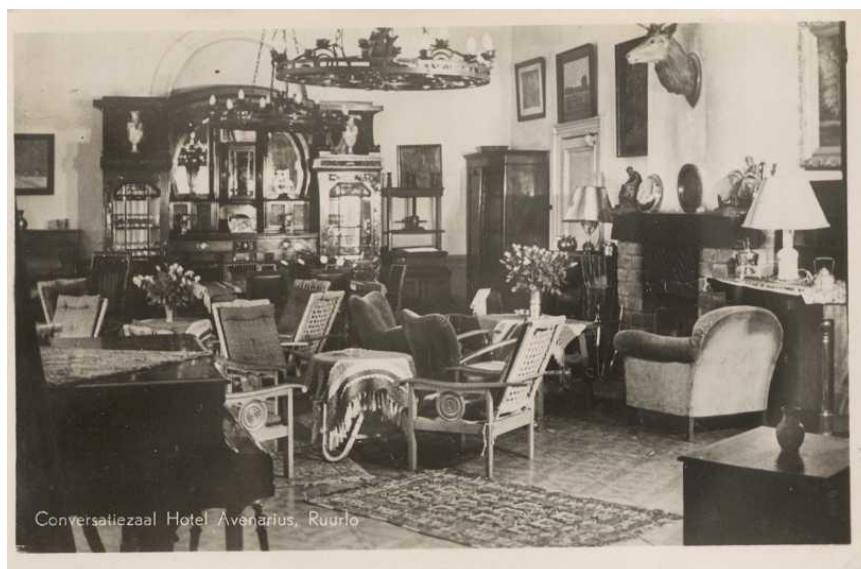
Interieur Avenarius 1935

Op 24 januari wordt de uitslag bekend van de aanbesteding van de verbouwing. Er zijn drie aannemers geweest die hebben ingeschreven op de massa; te weten,