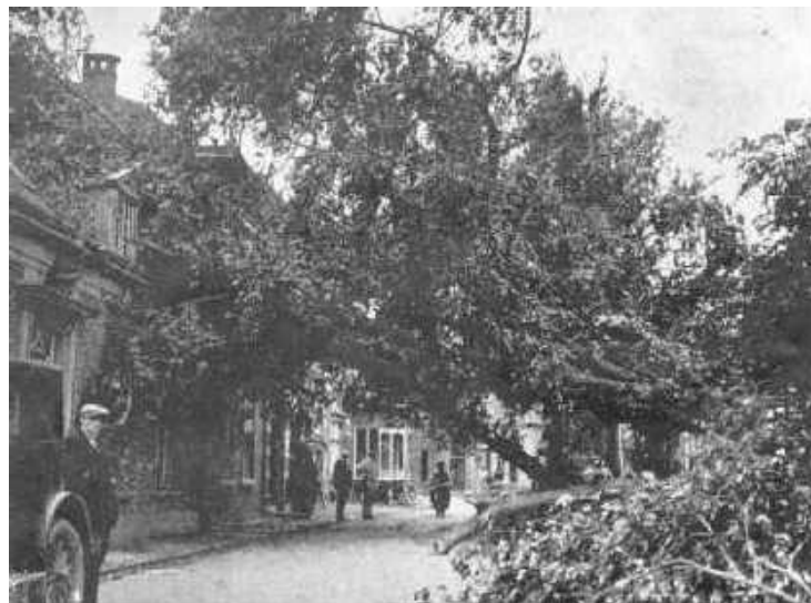
Een eikeboom in Ruurlo vormde een viaduct voor Hotel "Keizerskroon".