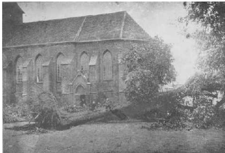
Een eikeboom, met een omvang van 4 M, sloeg met den top in het dak van Hotel "Keizerskroon" te Ruurlo.

Bij het artikeltje stonden de volgende foto's afgebeeld: