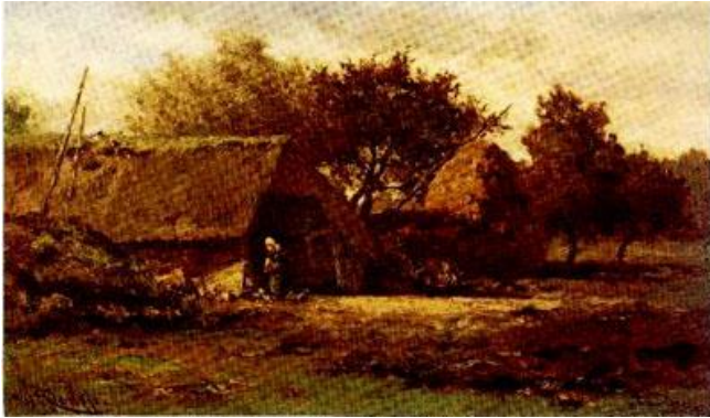
Wagenschuur en hooimijt te Ruurlo, geschilderd tussen 1857 en 1867 door Willem Roelofs (1822-1897). Oorspronkelijke opschrift luidt: "Hangar et meule à Ruurlo".