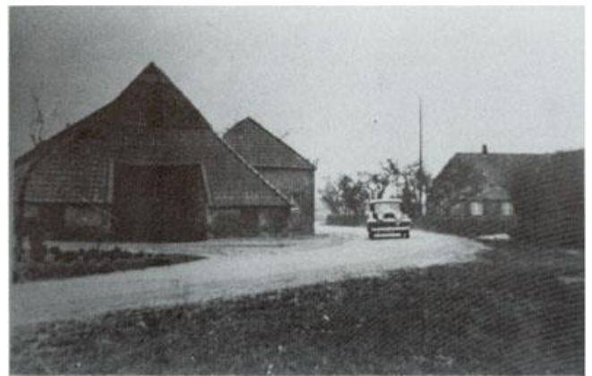
Foto van de Borculoseweg met links de boerderij 'TerHaarshuus' of 'Eikelkampshuus'