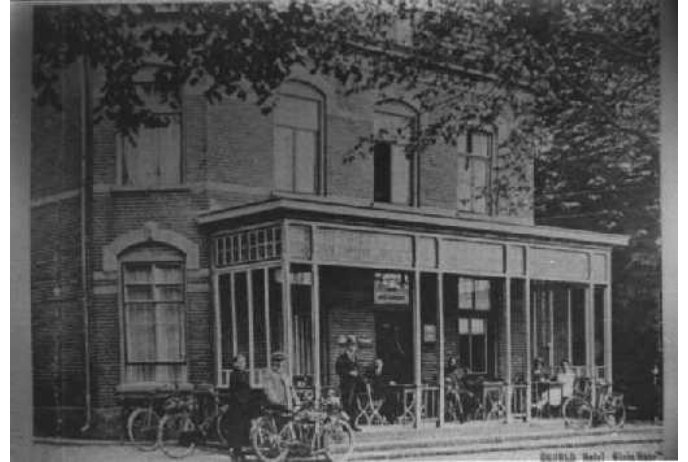
Hotel Klein Haar (circa 1930)