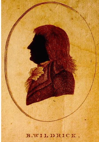
Berent Wildrik, anonieme gravure.