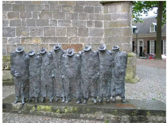
Ootmarsum De Paoskeerls

Het begon effen goed te raegenen. Toen de bujje aover was ging de tocht binnen-deur naor Ootmarsum. Hier kon men de olde karke effen bewonderen, met doorbie 't standbeeld veur die kaerls die met Paosen door deur de stad fladdert (vleugeln heit dat geleuf ik).