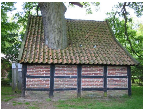
Schure met boom bie Brecklenkamp

Bie 'n boerderie was vrogger un klein schuurke um un eikenbeumken e-bouwd, an 'n bestaonde schure. Noe was dat 'n hele grote eike met 'n schure derumhen 'ewodden.