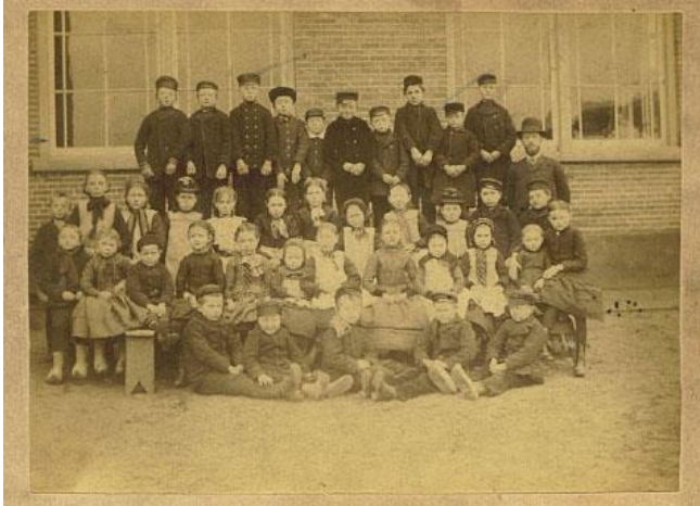
Foto 2: Een klasfoto van de Kerst Zwartschool uit vermoedelijk 1890.