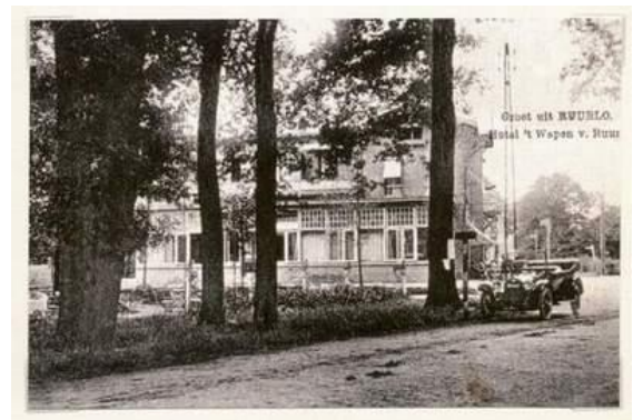
Hotel Het wapen van Ruurlo o.g. Avenarius