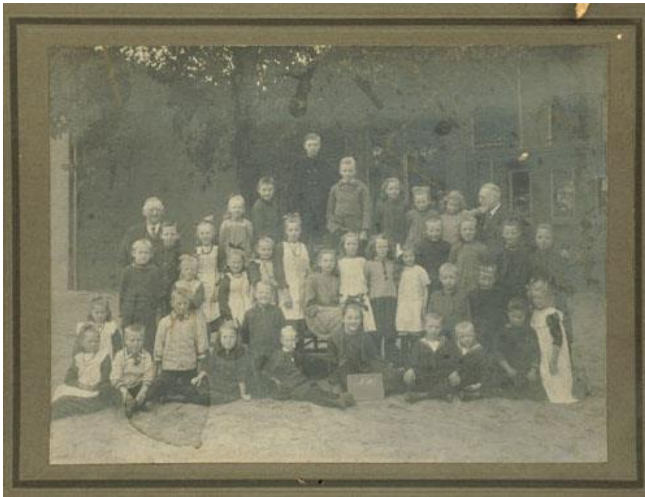
Foto 3: Een klasfoto van de Kerst Zwartschool uit vermoedelijk 1920.