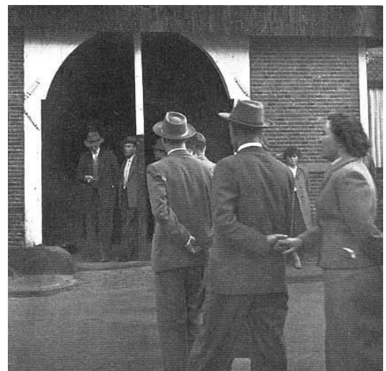
Het vlöggen rond1965 V.V.V Ootmarsum.

( 't volksgebruuk vlöggen vöndt plaats onder leiding van de acht Paoskeerls. Dat bunt vriegezellen knapen van onbesproken gedrag .Dee gaot met 'n hele riege stadsgenoten achter zich an de straoten deur, van 't ene huus naor 't andere. Doorbie staot de olderwetse deuren lös, en trekt ze um den middeler. )W.Bl.