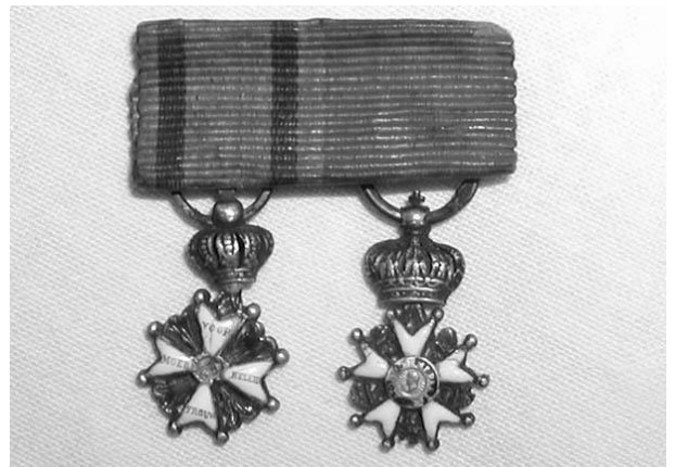
Links Militaire Willemsorde voor Moed, Beleid en Trouw. Rechts de medaille Honneur et Patrie Napoleon Empereur de France(Legioen van Eer)

Bronnen : als boven vermeld . informatie M.W.O. van internet. Streekarchivariaat-Doetinchem