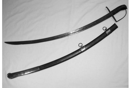
handvat zwaard gebruikt tijdens de veldtochten - Zwaard met schede afkomstig uit deelstaat Hessen; in het zwaard staat gegraveerd Solingen 1790, lengte zwaard incl. handgreep 97 cm, totale lengte incl. schede 104 cm, schede is voorzien van koperbeslag met ringen

Hieronder foto's van 2 sabels met heft en beschermer uit 1790, gemaakt in Hessen.