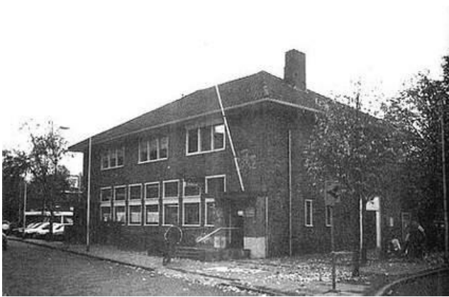
Postkantoor Denekamp 1998