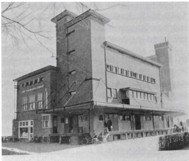
De fabriek met links de winkel

In 1924 begint de behoefte aan nieuwe ruimte dringender te worden, doch men kan geen eensluidende mening verkrijgen over de plaats van vestiging. Het ging er toen om of uitbreiding van het bestaande, of verplaatsing van het bedrijf naar het in 1920 aangekochte stuk grond van de Marnix. Men besluit in 1926 eindelijk tot nieuwbouw op dezelfde plaats. Er verrees een voor die tijd goed ingericht malerijbedrijf met kantoor en winkel.