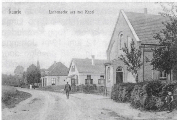
Kapel Barchemseweg op een oude ansicht

Uit berichten in de Graafschapsbode van 13 oktober 1914 blijkt over Ruurlo: "In een zeer bezochte samenkomst van Dames en Heeren, is besloten tot het oprichten van een comité, dat zich zal beijveren een honderdtal Belgische vluchtelingen een onderdak te bezorgen, zoowel in een gemeenschappelijk verblijf als bij particulieren. Velen hebben zich bereid aangemeld om één of meer vluchtelingen in hun huis te nemen."