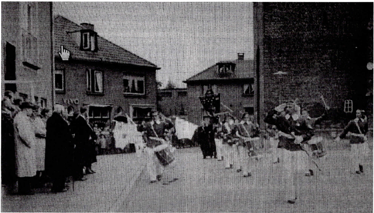
Schutterij St Hubertus bij de opening van het gemeentehuis, 29 mei 1954.

Vermoedelijk was er in Ruurlo in die tijd geen echte schutterij actief. Bekend is dat er in bijvoorbeeld plaatsen als Zutphen en Lochem in de patriottische tijd (eind 18 e eeuw) een vrijkorps bestond, dat ook in de strijd tussen orangisten en patriotten een factor van betekenis was ten gunste van die laatste groep. Omdat er in Ruurlo onder invloed van de Van Heeckerens niet zoveel patriottische geestdrift was, vermoeden we dat hier geen vrijkorpstraditie was.