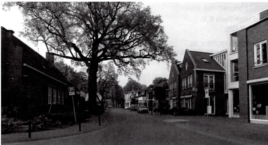
Hoek Dorpsstraat- Domineesteeg. 8 mei 2017.

gevestigd. Navis werd er de kassier. De nieuwe Rabobank werd in 1951 gebouwd aan de overzijde waar de dokterswoning stond links op de foto en werd in 1952 geopend. Verder zien we rechts de smederij Huitink en nog het oude pand van de fam. Huitink dat ca. 1910 is afgebroken. Daarnaast het huis van Romville waar later de woning is gebouwd die er nu nog staat op nr. 12. Links achteraan het pand waar nu de 'Unive' is gevestigd.