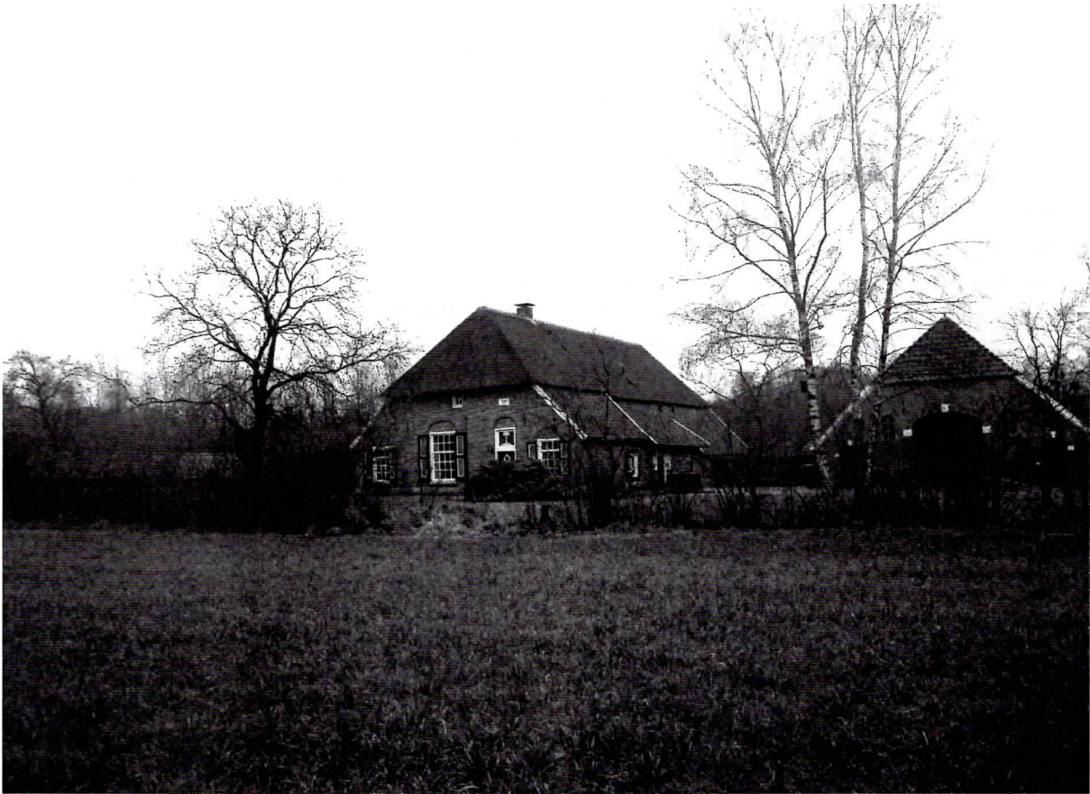
Kerkwijk vanuit de kamp gezien.