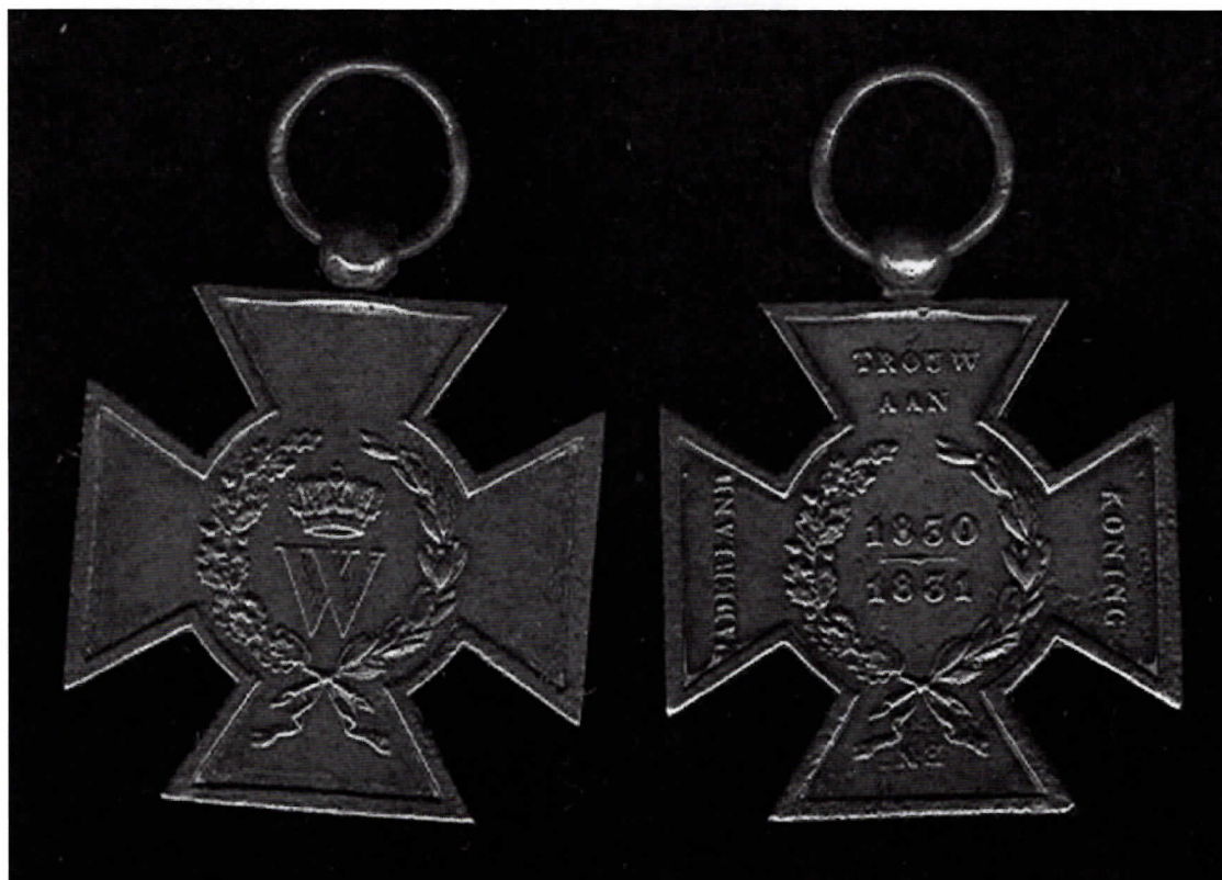
Metalen kruis, ter herinnering aan Tiendaagse veldtocht tegen België.

Of dat betekent dat er precies zeventig schutters uit Ruurlo mobiel waren, of dat de breinaalden zo geestdriftig hadden getikt dat er een dubbele of driedubbele sokvoorraad voor de mannen was: we weten het niet. Maar Sing zal niet in zijn eentje al die sokken hebben ontvangen!