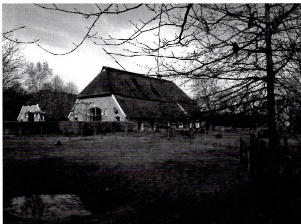
Kerkwijk vanuit het zuidoosten gezien.

Op de zuidelijke rand van de Kerkwijkerkamp heeft eeuwenlang een boerderij gestaan met de naam Kerkwijk. In de vroege en hoge middeleeuwen (500-1300 na Chr.) vestigden nieuwkomers zich meestal op hoger gelegen plekken. Zij vestigden zich bij voorkeur aan de rand van een hoogte tussen het hoog gelegen bouwland en lager gelegen weiden en hooivelden in de buurt van water. Dat is ook precies de situering van boerderij Kerkwijk op de kamp. In de loop der eeuwen is de Kerkwijkerkamp geleidelijk hoger geworden door bemesting met mest en heide- of grasplaggen waardoor bovenop de zandrug een laag vruchtbare zwarte aarde (enkeerdgrond) is ontstaan van bijna een meter. Dat is nog goed te zien aan een oude holle zandweg (schapendrift ?) die ongeveer vanaf boerderij Plasbekke (Muldersweg 2) in westelijke richting dwarsdoor de Kerkwijkerkamp loopt en uitkomt vlakbij de vroegere boerderij Grote Haar of Haderboer (nu Wensink aan de Haarweg 3). Aan de zuidwestkant van de Kerkwijkerkamp is nog een steilrand te zien begroeid met eiken en grote oude hulstbomen. Aan de oostkant loopt het land geleidelijk af naar de Baakse beek en het Kerkwijkerbos