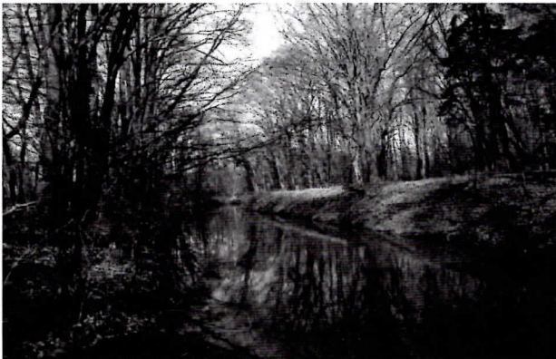
Baakse beek ter hoogte van Kerkwijk.