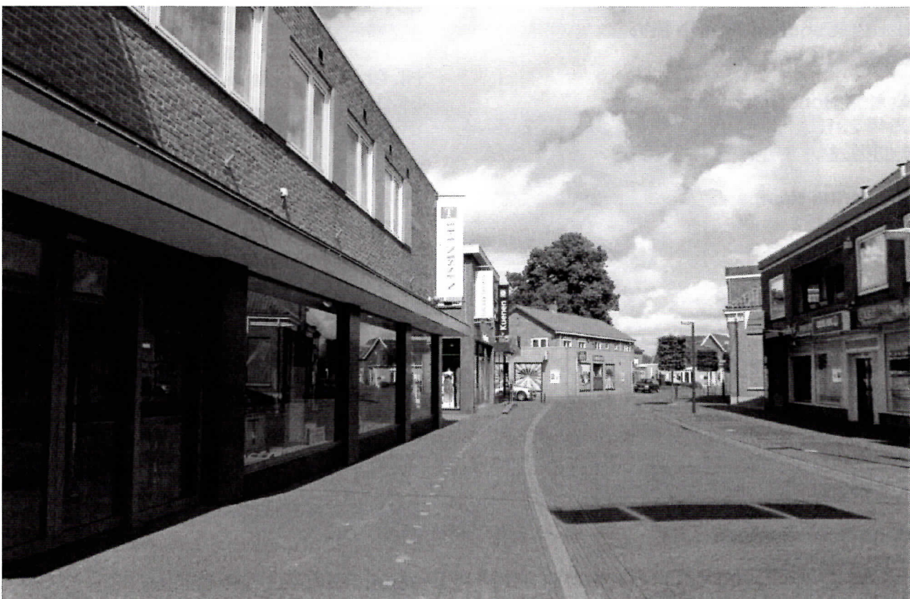
Dorpsstraat 13-08-2017.