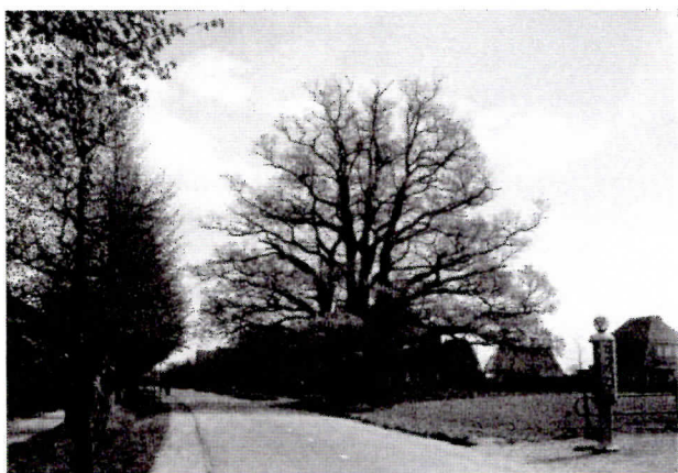
De Kroezeboom aan de Borculoseweg in Ruurlo rond 1930.