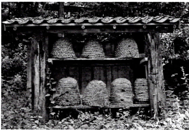
Een vooroorlogse "iemenschoer".

organiseerde ook cursussen en gaf een zeer informatief en leerzaam maandblad uit. In 1909 kreeg de VBBN van de regering toestemming om accijnsvrije gedenaturaliseerde suiker als wintervoer voor de bijen te verkopen aan imkers (7,5 kilo per bijenvolk). Bij de distributie van deze goedkope suiker werden de lokale afdelingen ingeschakeld. Het aantal leden nam hierdoor gestaag toe. In 1913 waren er bijna 6000 leden met ca 45000 volken. In de Achterhoek waren er toen al 7 afdelingen (Groenlo, Neede, Hall, Winterswijk, Doetinchem, Warnsveld en Dinxperloo).