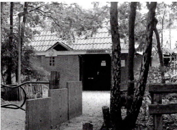
De Tuitertbult, 17-08-2017.

De blokhut kreeg een herindeling en renovatie en werd verwezenlijkt met weer de inzet van de ouders. Gestart werd op 19 september 1987 en wel in drie fasen, waarna 'de Tuitertbult' feestelijk heropend kon worden.