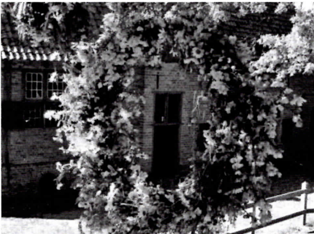
Pinksterkroon bij de Lebbenbrugge.

Al onze Achterhoekse kroniekschrijvers, van Heuvel, Odink, tot Heitling en Krosenbrink, melden ons wel een stukje kennis over oude gebruiken rond Pinksteren in de Achterhoek. Ze maken duidelijk dat oude Germaanse vruchtbaarheidsrituelen door de eeuwen in de dorpen zijn vermengd geraakt met het christelijke verhaal van Pinksteren.