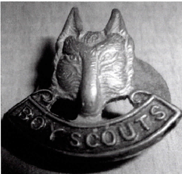
Geëmailleerd padvinders symbool. Foto uit Scouting archief.