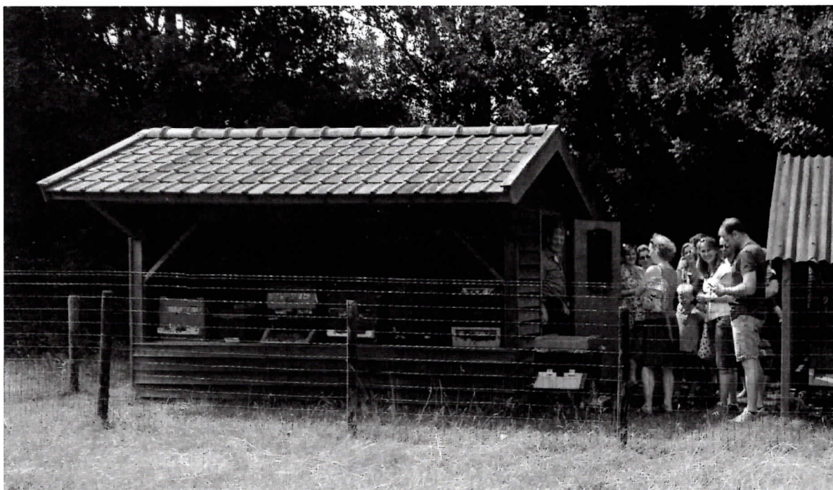
Imkerdag 2017 bij de bijenstal van Bertie Klein Elhorst